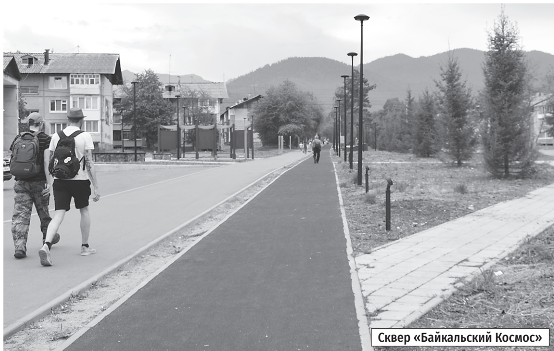
Сквер «Байкальский Космос»

А на очереди — новые общественные пространства, за которые люди проголосовали уже в нынешнем году. Самыми активными в 2026 году стали Иркутский муниципальный округ, Иркутск и Ангарск. Поздравляю авторов проектов-победителей!