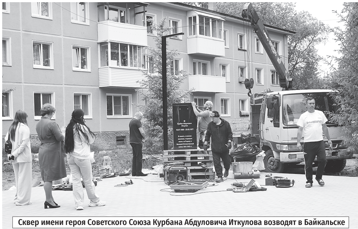
Сквер имени героя Советского Союза Курбана Абдуловича Иткулова возводят в Байкальске

Вполне закономерно, что по количеству собранных голосов лидируют Иркутск, Ангарский городской и Иркутский муниципальный округа. Но вкус благоустройства уже