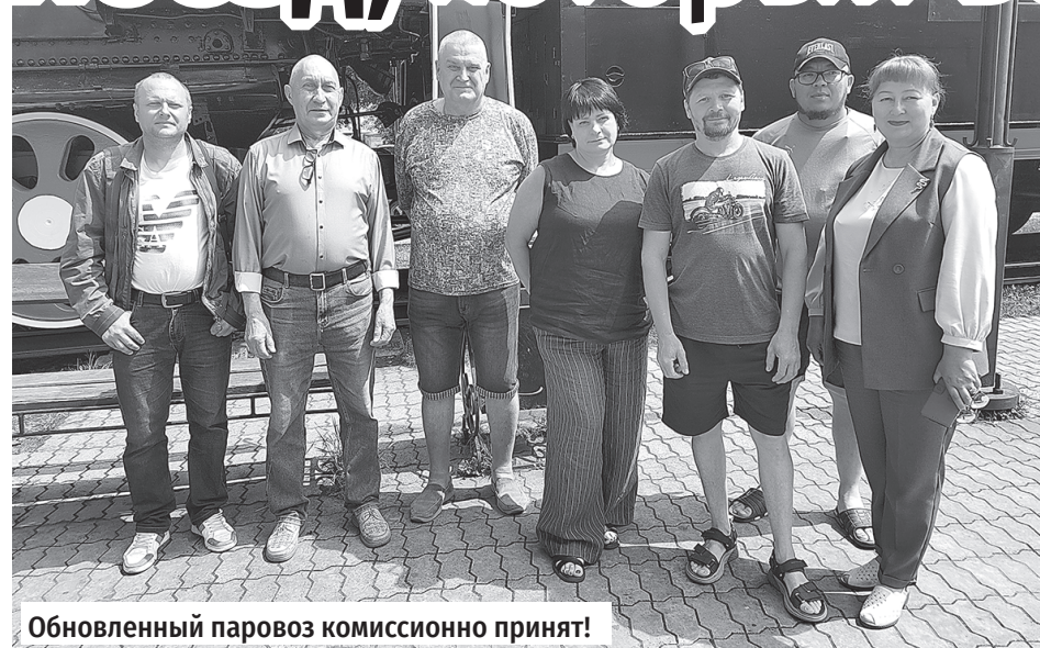
Обновленный паровоз комиссионно принят!

отремонтировало пять единиц старых паровозов и тепловозов к 50-летию БАМа. Паровоз в Слюдянке – шестой по счету.