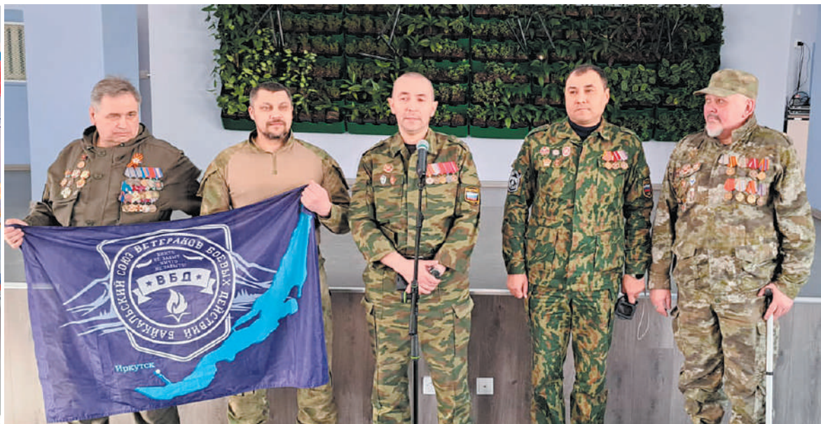
Напутствие от ветеранов боевых действий

Замечательное по своему патриотическому настрою мероприятие прошло в минувшую пятницу. Школа №1 приняла учеников в ряды первого кадетско-казачьего класса.