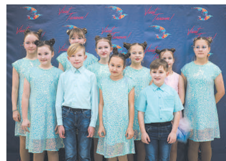
Вокальная студия «До-ре-ми»

В Иркутской области прошел VII Байкальский международный ART-фестиваль-конкурс «Vivat, талант!». Его участниками стали более 1,5 тысячи солистов и творческих коллективов. Это более 11 тысяч человек из России, Китая, Монголии, Нигерии, Ганы, Зимбабве и Индонезии.