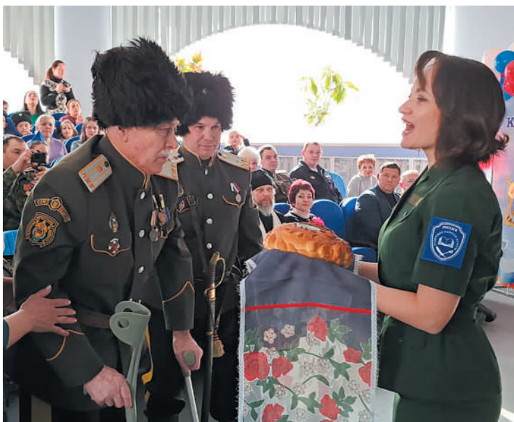
Хлеб-соль для атамана