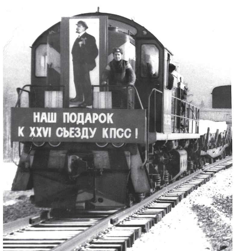
По таким путям мы вели первый поезд в Усть-Нюкжу