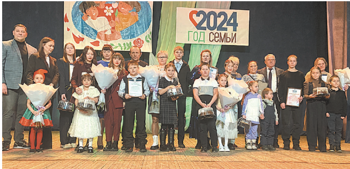
Байкальск. Чествование семей, воспитывающих четверых и более детей