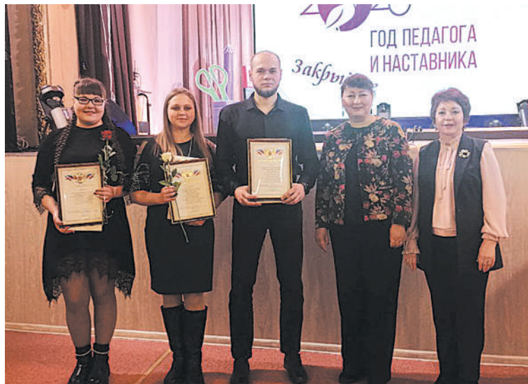
Чествование молодых педагогов