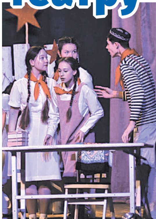
Сцена из спектакля «Тимур и его команда»