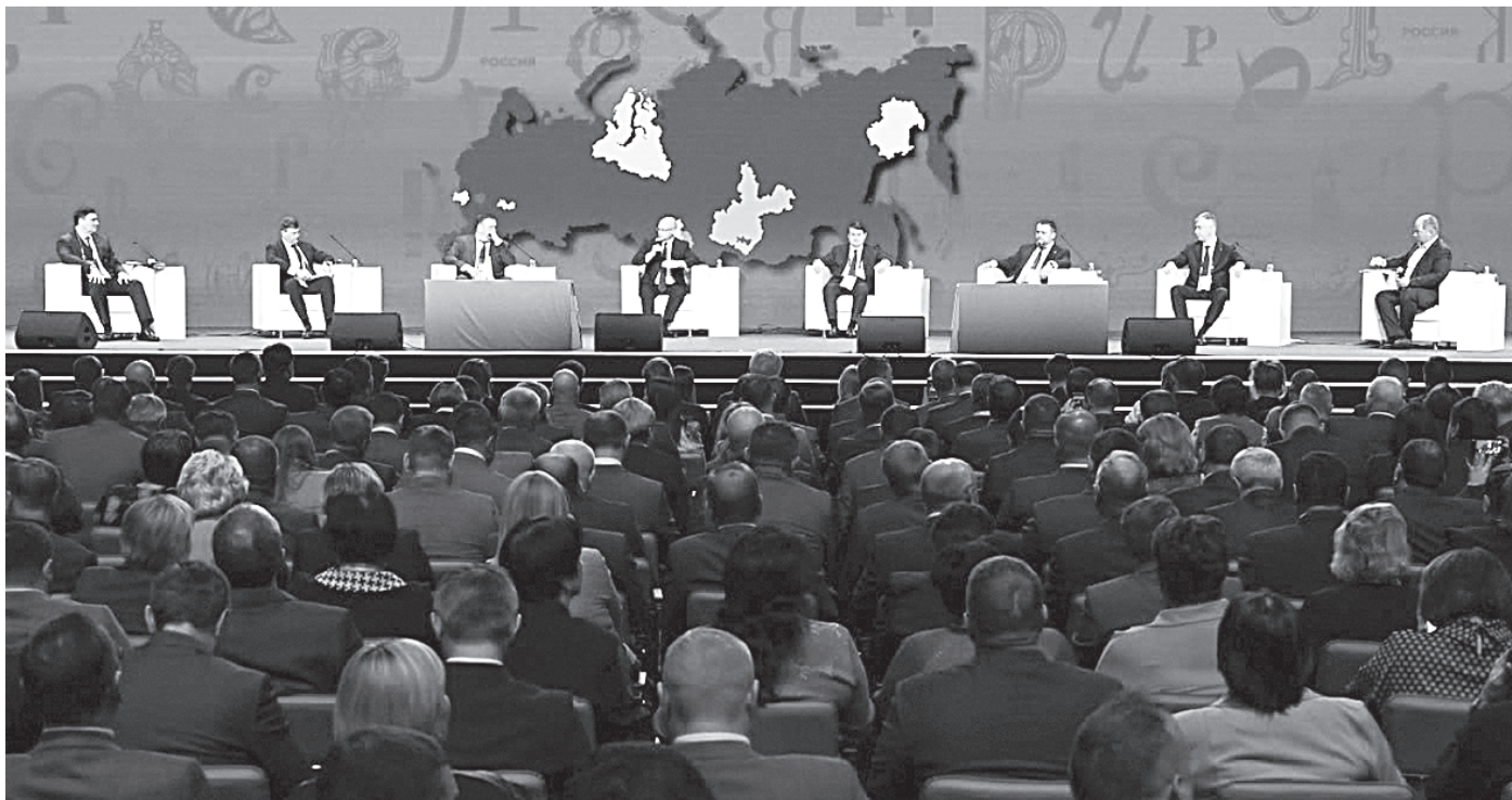
Панельная дискуссия «Сила в людях»