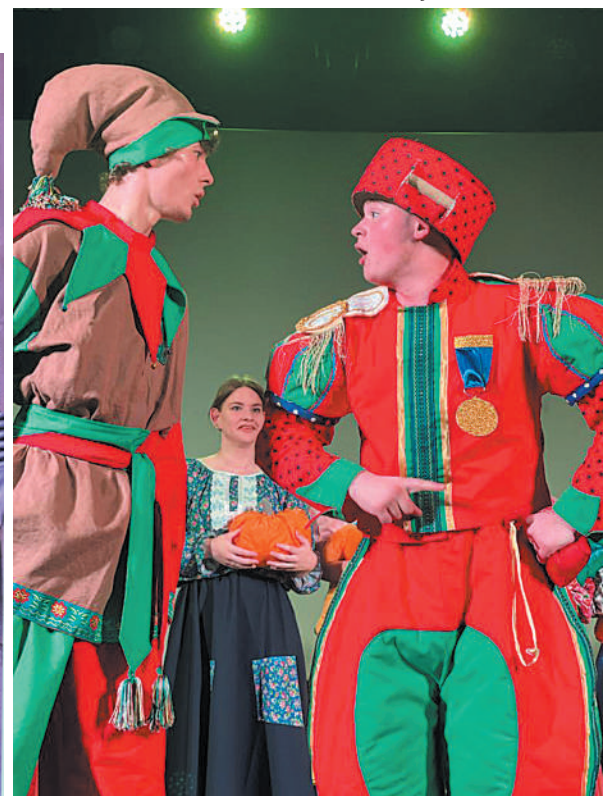
Сцена из спектакля «Страсти по Насте»

Приходят и те, кто театром в своей взрослой жизни больше не занимается. В любом