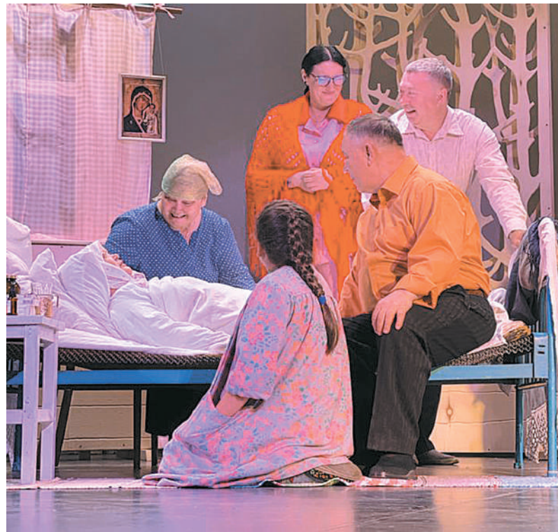
Сцена из спектакля «Последний срок»