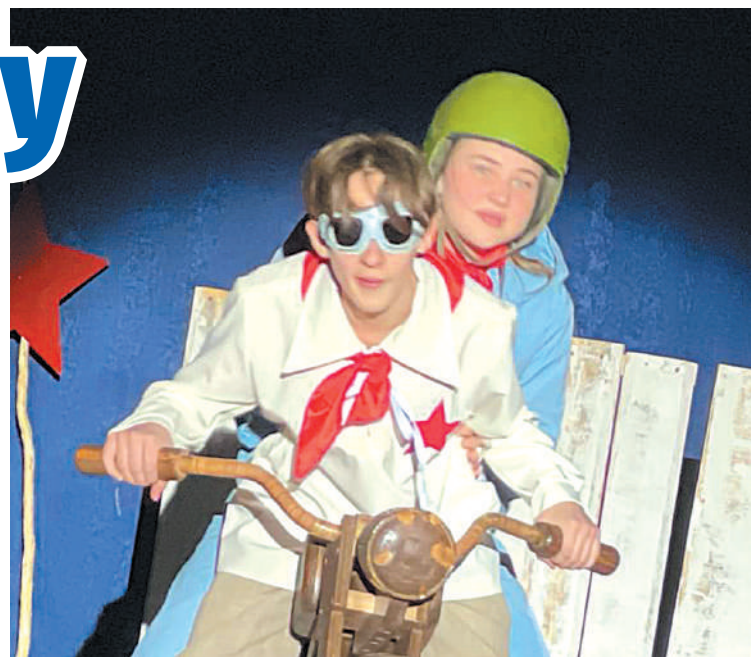
Сцена из спектакля «Тимур и его команда»