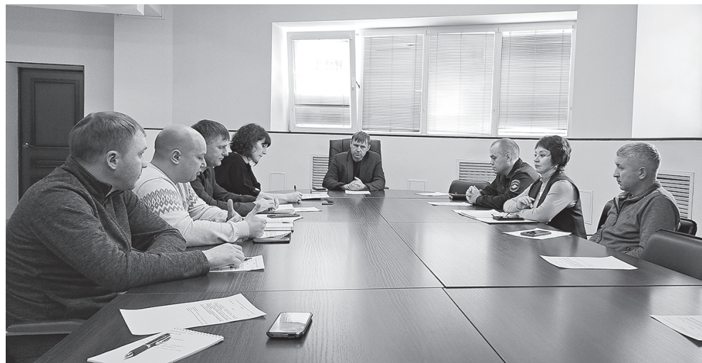
Во время совещания

емя. Также представители местных органов власти заверили, что при уборке дорожного полотна в городах и поселениях используется только отсев. А использование реагентов при чистке федеральной трассы допустимо ГОСТом и не наносит вреда окружающей среде.