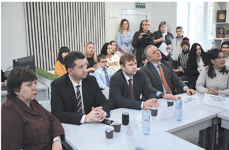
На секции «Туризм». За столом - представители районов