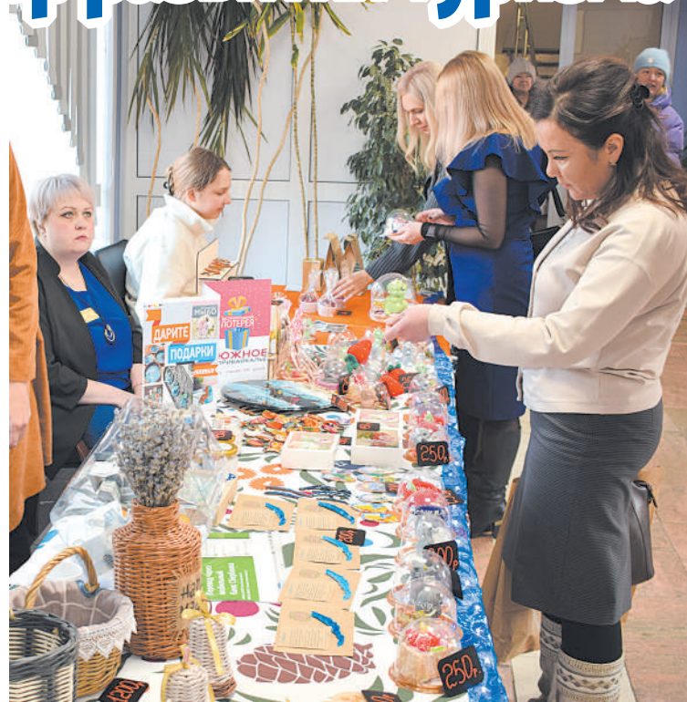
Сувенирная продукция, представленная на Форуме

Итогом обсуждения стало подписание четырехстороннего соглашения о намерениях межмуниципального сотрудничества районов, в котором определены направления совместных усилий территорий по продвижению туристического проекта «Сибирский тракт