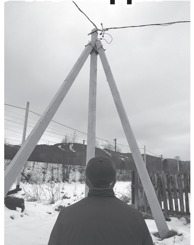
Новые сети в СНТ «Прибрежный»

С 2018 года мы начали участвовать в этой программе, сейчас мы в стадии финиша фактического приведения электросетевых хозяйств СНТ в надлежащее состояние.