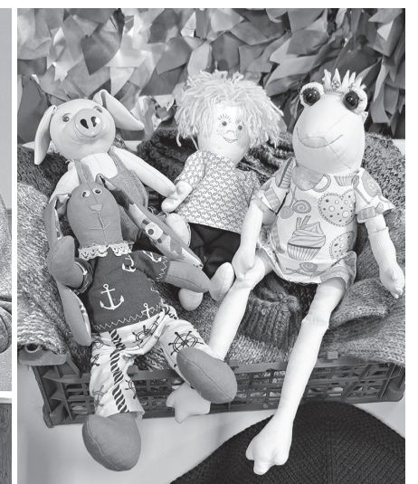
Игрушки Ольги Шенхоровой