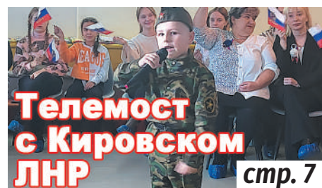
Телемост с Кировском ЛНР стр. 7