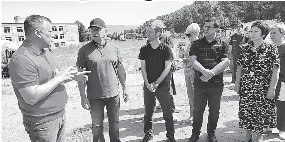
Посещение губернатором области Игорем Кобзевым строящейся школы

Школа Слюдянки под номером один сегодня вновь в центре внимания общественности, только в этот раз со знаком плюс. Напомним, что в 2019 году в микрорайоне Рудоправление началось строительство нового здания школы на 725 мест по государственной программе «Развитие образования». В декабре прошлого года работы были остановлены, а в феврале текущего администрация Слюдянского района расторгла контракт с подрядной организацией.