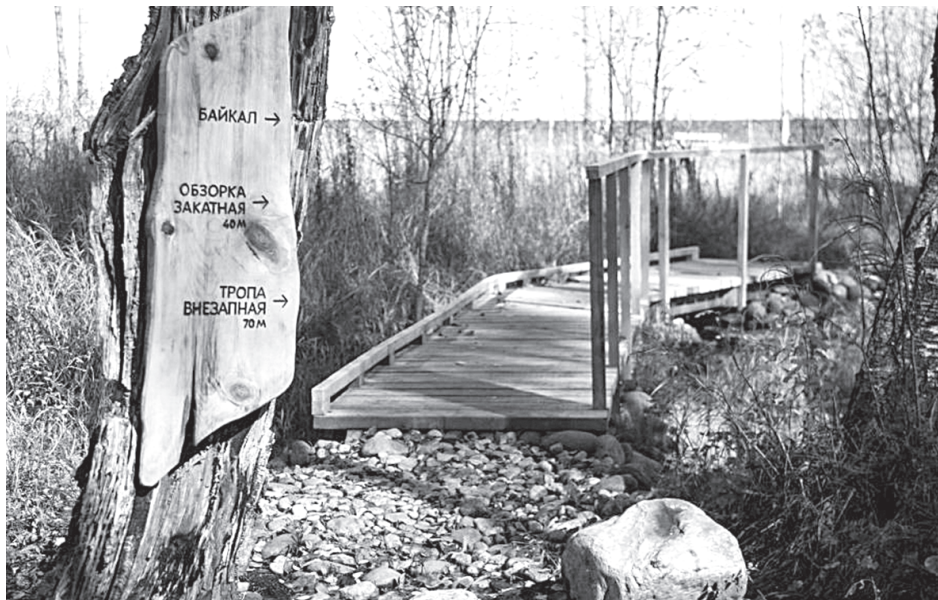
Тропа. Магнит для туристов