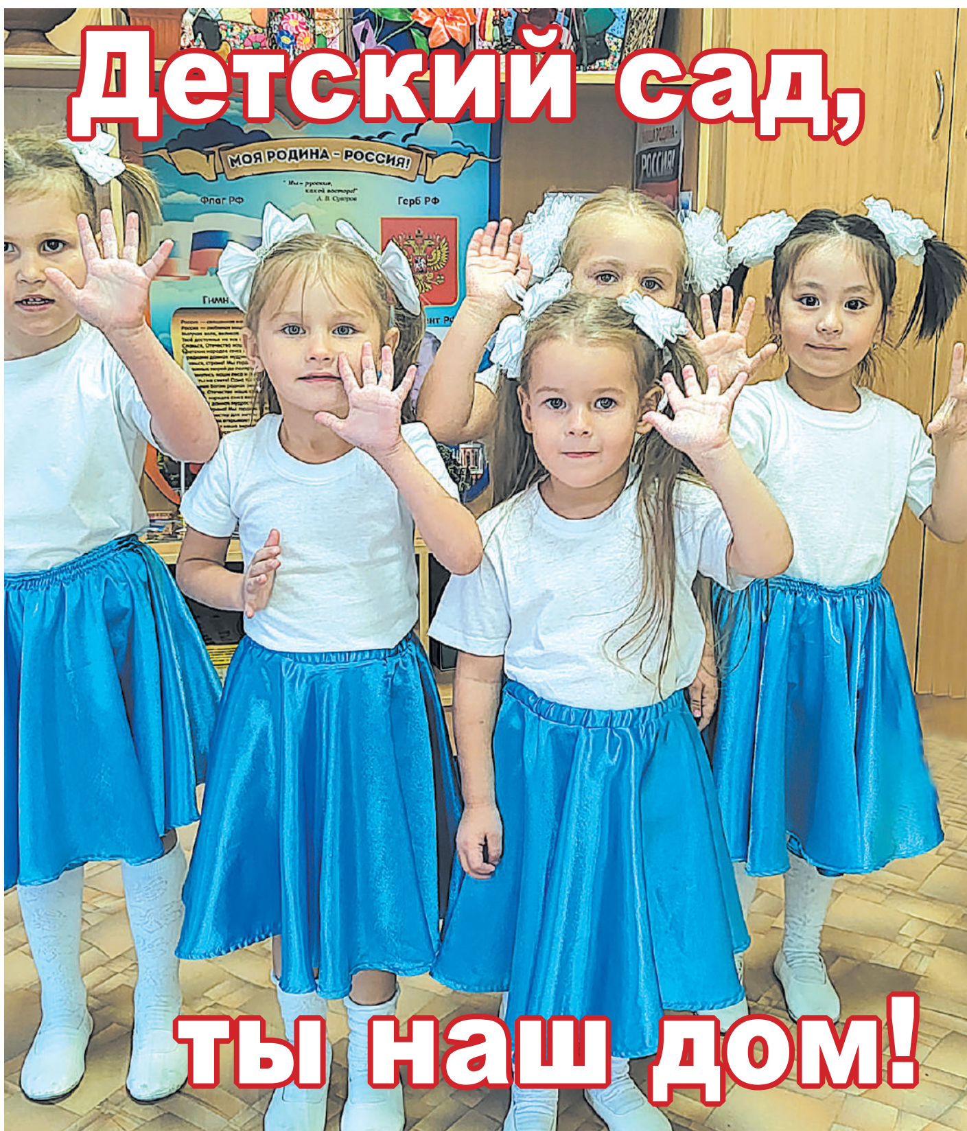
Малыши средней группы радуются празднику

55 лет для истории всего лишь миг, а для многих поколений выпускников, ветеранов труда и нынешних воспитателей – это незабываемое событие, которое дарит прекрасные воспоминания о ярких буднях и открывает новые страницы творческой деятельности. Эта замечательная история учреждения и коллектива создавалась