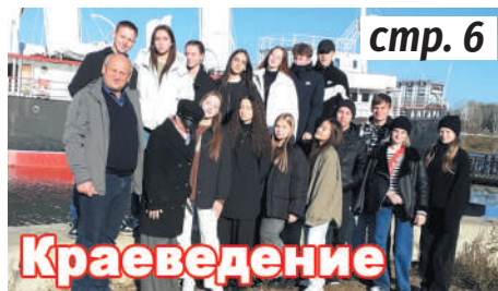
Краеведение стр. 6