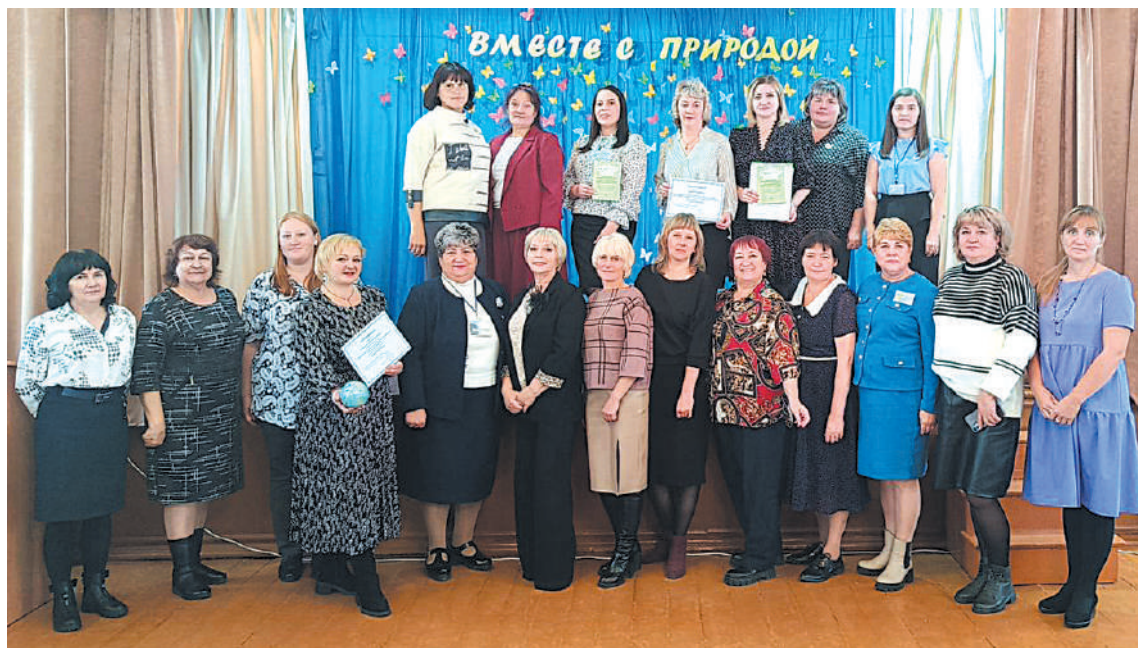
Общее фото участников

Программа «Экошколы/Зелёный флаг», направленная на экологическое образование и сертификацию школ, проводится на четырёх континентах международной организацией по экологическому образованию (Foundation for Environmental Education – FEE).