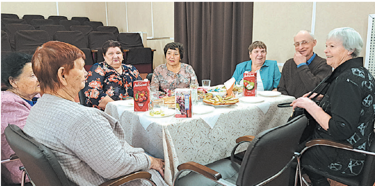
За праздничным столом