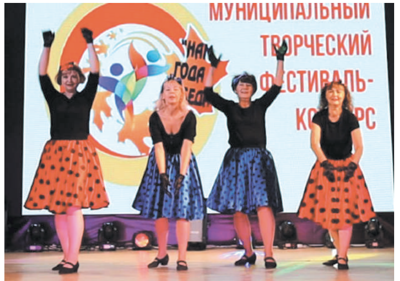
Хореографический коллектив «Шарм»