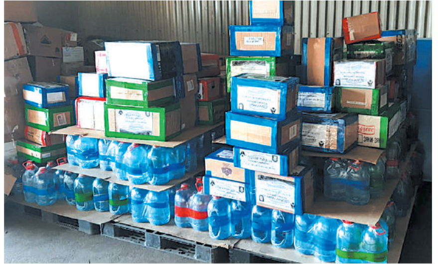
Гуманитарный груз доставлен до Иркутска