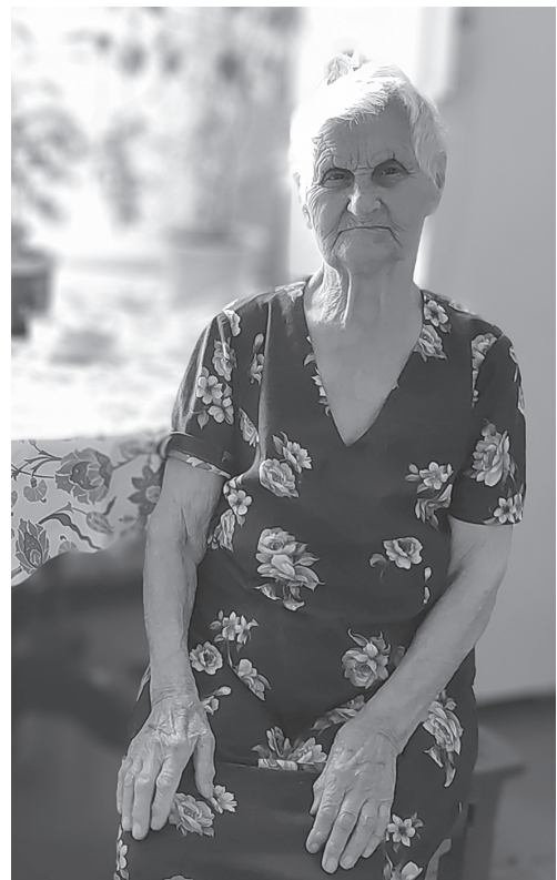
Фото сделано автором за день до 95-летия

Дорогие читатели, если увидите на Стройке возле магазина бабуську, которая продает коврики, знайте, что это и есть героиня нашей статьи, которой идет 96-й год! Я думаю, нам всем срочно нужны такие коврики.