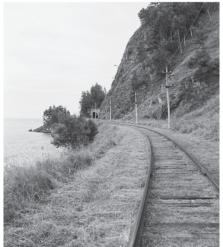
Мой поход по КБЖД

Моё пешее путешествие по КБЖД было завершено на станции Байкал. После завершения похода мне стало ясно, почему в начале XX века КБЖД называли «Золотой пряжкой на поясе Транссиба» – выполненный там объём работ был колоссальным как по трудозатратам, так и по денежным вложениям. (Примечание к тексту: километраж на КБЖД начинается от станции Иннокентьевская, сейчас она называется Иркутск-Сортировочный).