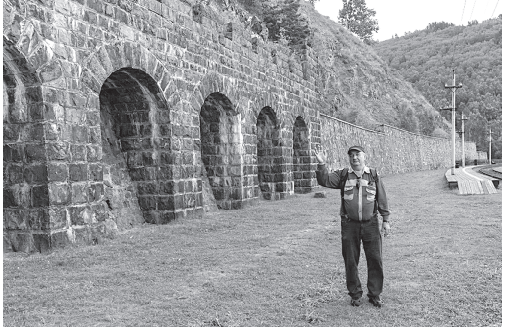
Всем читателям «Славного моря» передаю привет от Итальянской стенки