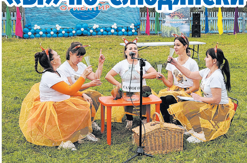
Впервые участие в турслете принимают команды детских садов

Светлана Гартованная.