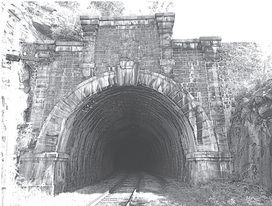
S-образный тоннель с боковым выходом в бухту Берёзовая