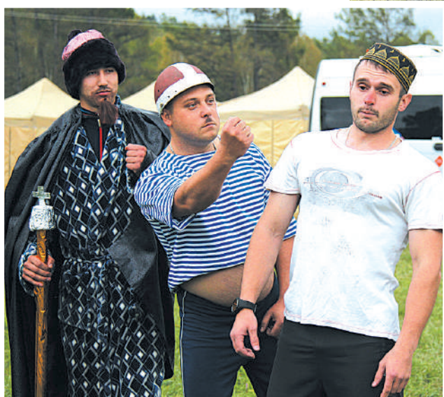
Участники перевоплотились в героев гайдаевских комедий