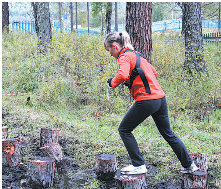
Прохождение этапа «кочки»