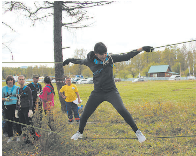
Прохождение полосы препятствий