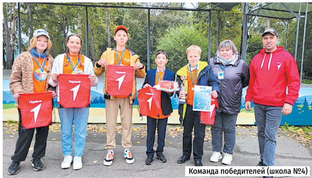
Команда победителей (школа №4)

истории промышленности Слюдянского района, Кругобайкальской железной дороге и проявили эрудицию в конкурсе капитанов.