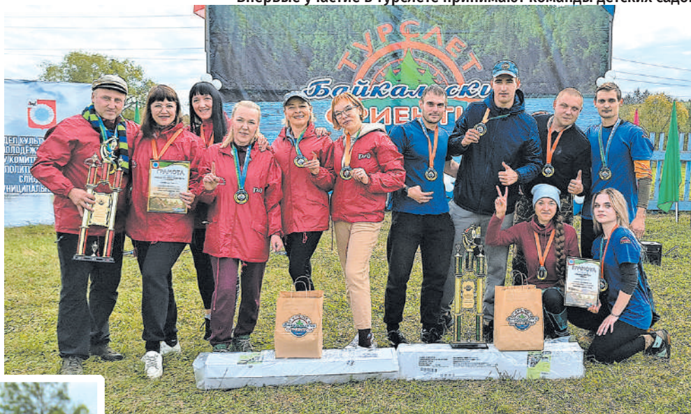
Красные – команда лицея №11; синие – команда пожарно-спасательной части