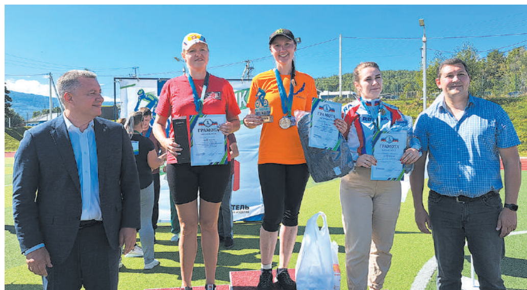
Награды получают женщины средней возрастной категории