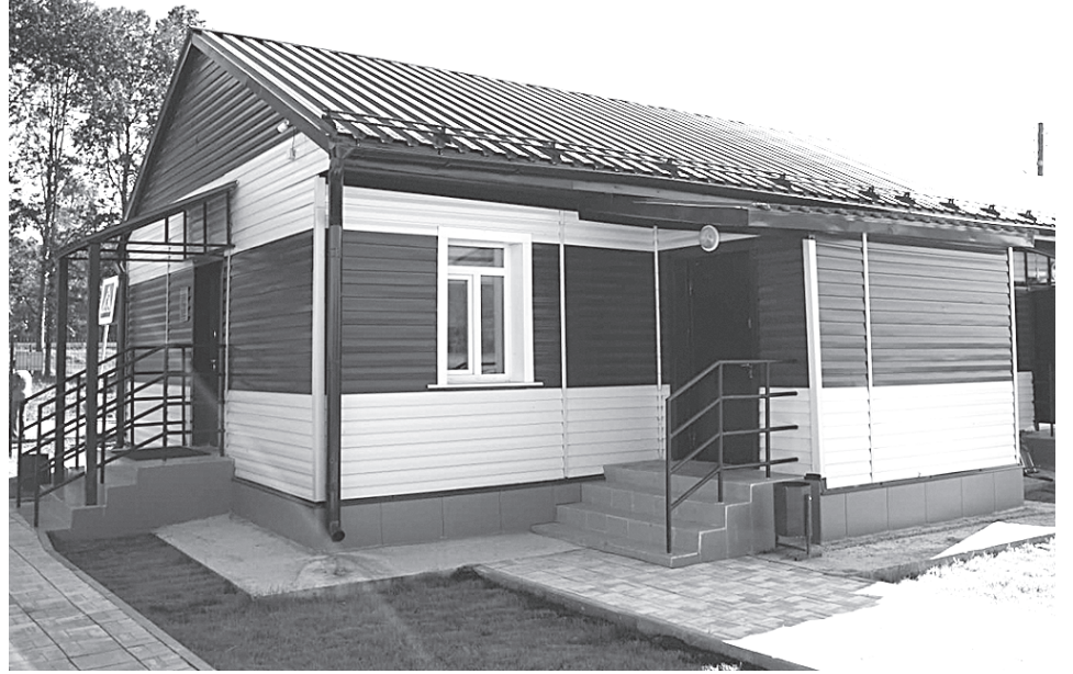
Дом культуры (д. Быстрая)