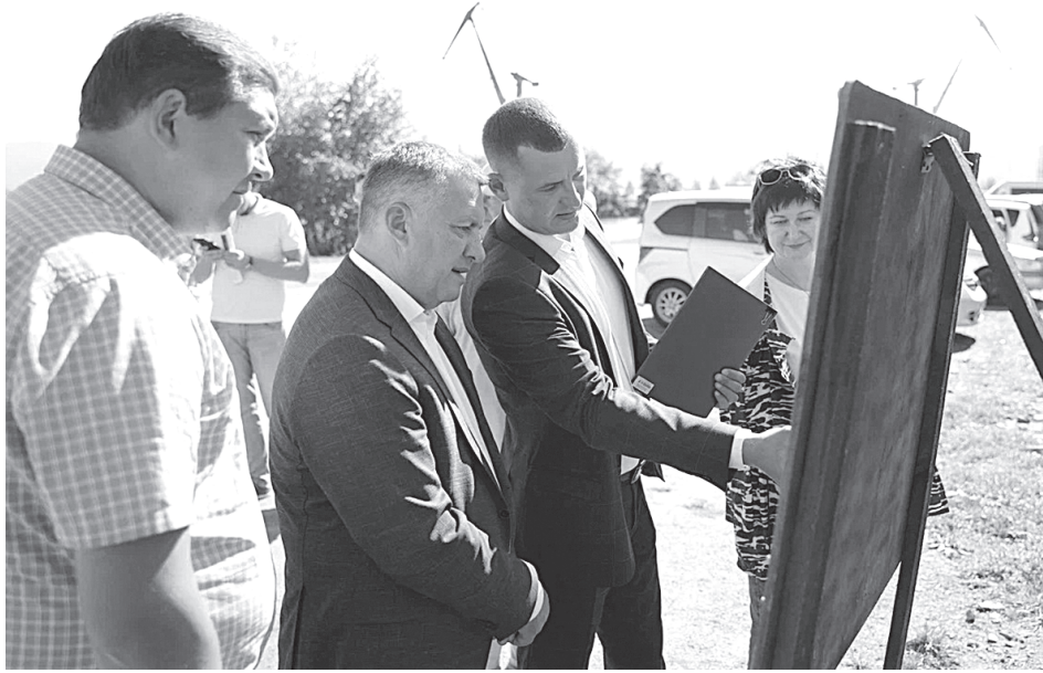
В Култуке на Набережной