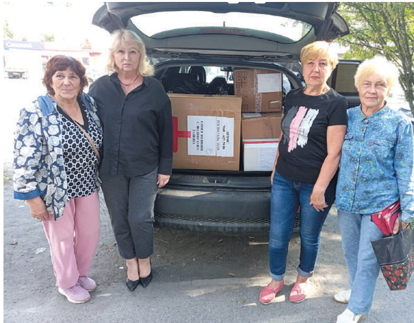
Отправка гуманитарной помощи