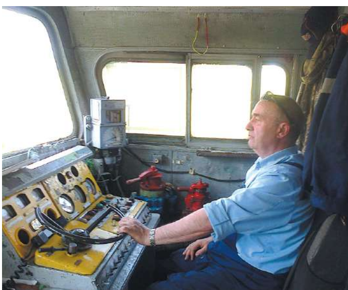
Балластировка пути перегона Звёздная-Чудничный, лето 2015 год