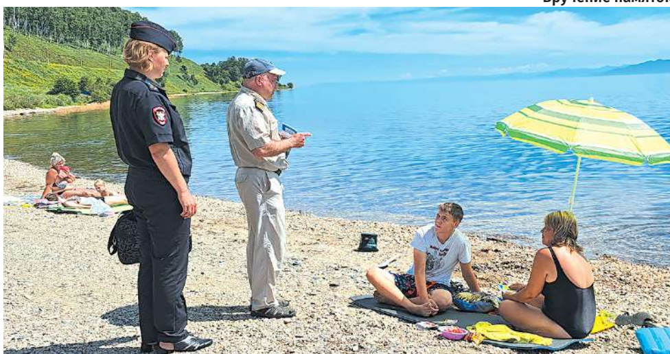
Информирование о запрете купания

В Иркутской области за два летних месяца произошло более тридцати происшествий на водных объектах с летальным исходом.