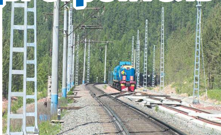
Строим разъезд Молчан, июль 2016 год

Десять лет назад - в первых числах августа 2013 году на Север нашей области, в посёлок Звёздный (БАМ), прибыли транспортные строители из города Белгорода. Им предстояло освоить большой фронт работы по повышению пропускной способности магистра-