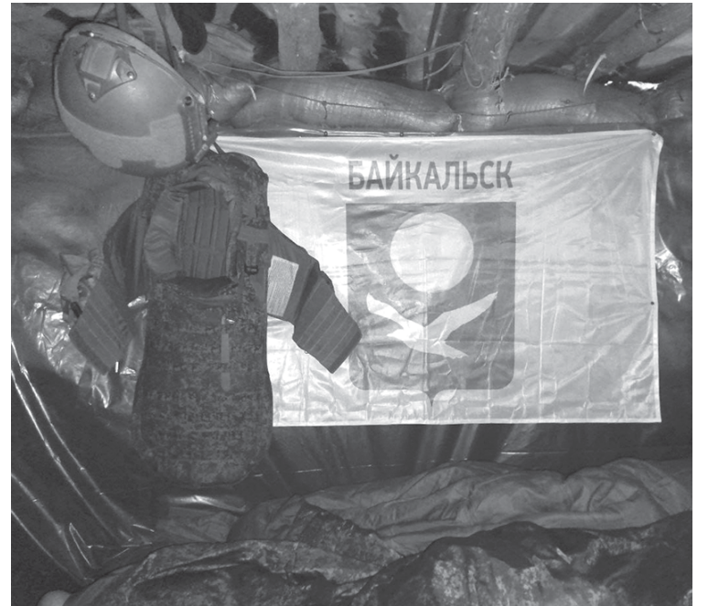
Флаг Байкальска в окопе на передовой