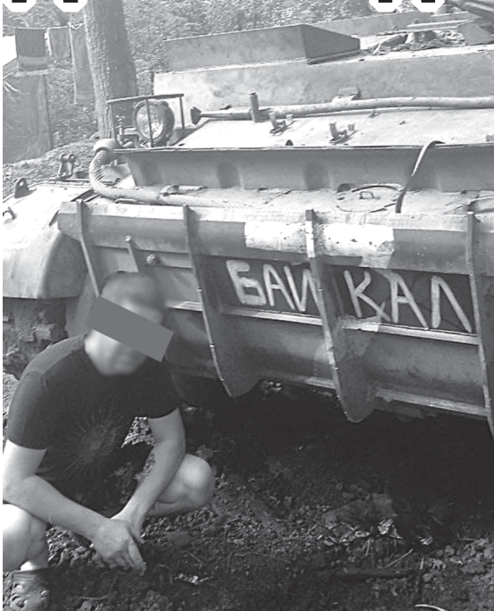
Надпись на танке