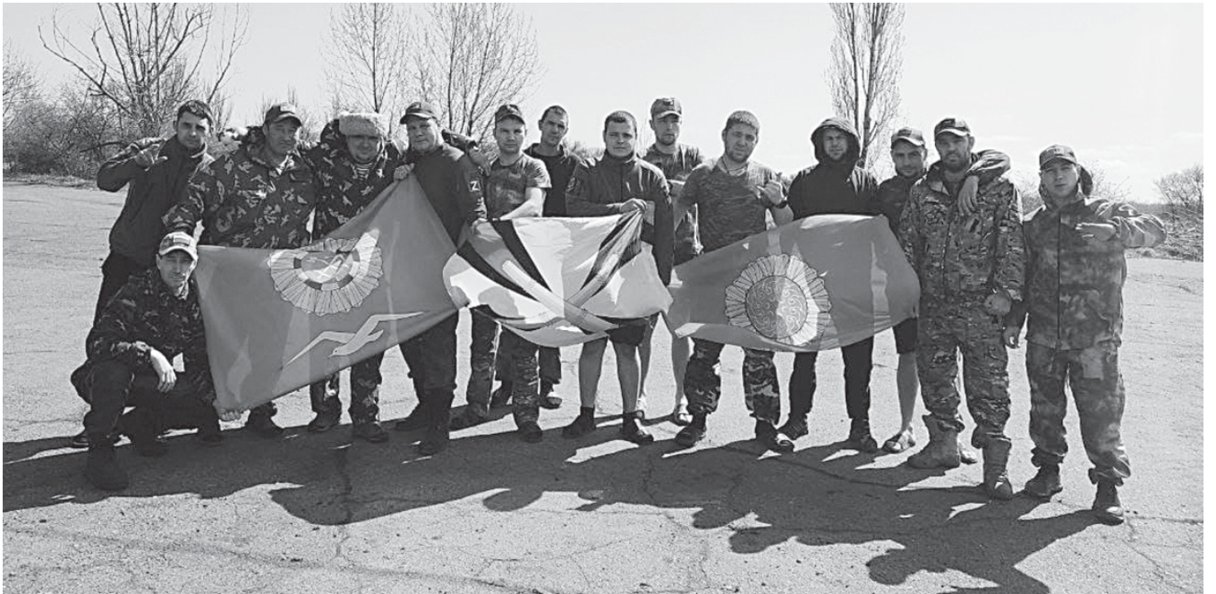
Участники СВО из Слюдянского района