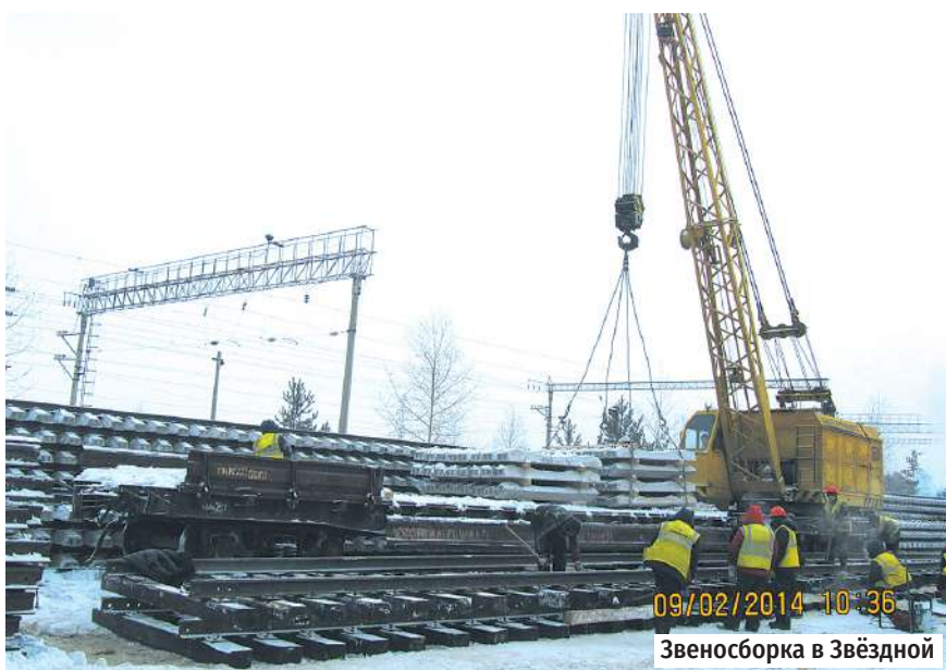
09/02/2014 10:36 Звеносборка в Звёздной