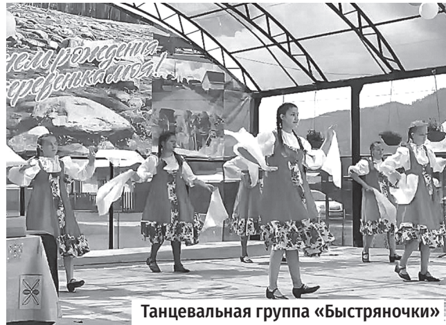
Танцевальная группа «Быстряночки»

Радует нас середина лета яркими красками, душистыми цветами, стрекотом кузнечиков и пением птиц. Праздник так и витает в воздухе деревенского края. И пусть страда в самом разгаре. Не успели отсадиться – отсеяться, вот уже и сенокос, а не за горами заготовки: соленья – варенья, грибы – ягоды. Как раз сейчас праздники и устраивать... Словом, Дни села в Быстринском поселении три дня справляли.