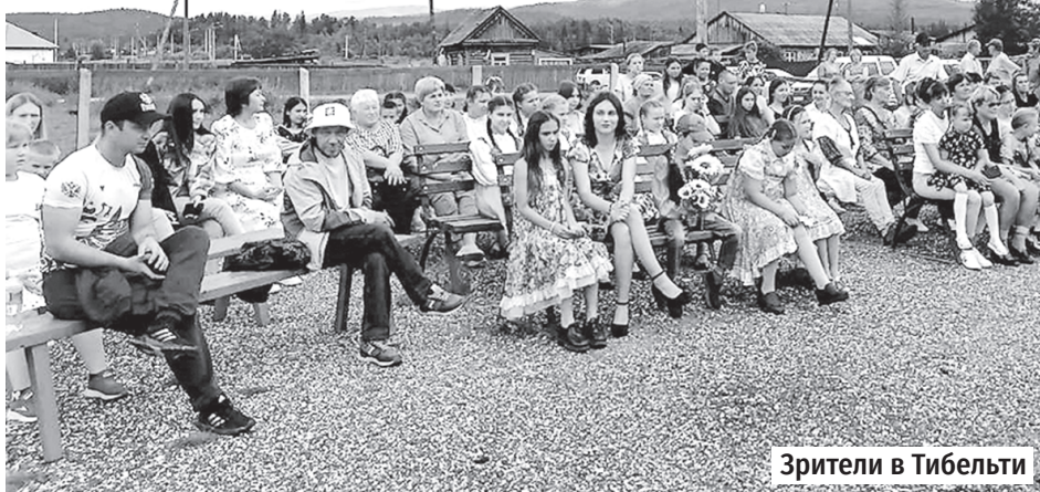
Зрители в Тибельти