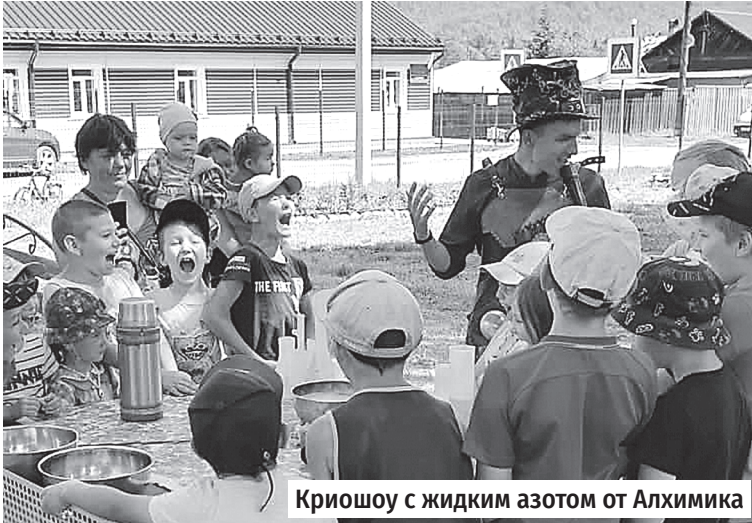
Криошоу с жидким азотом от Алхимика

В полдень для маленьких жителей деревни накрыли праздничный стол со сладостями и вкусностями. А после, вместе со взрослыми они