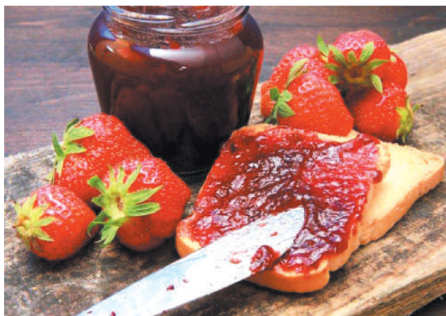
Конфитюр из клубники с желатином