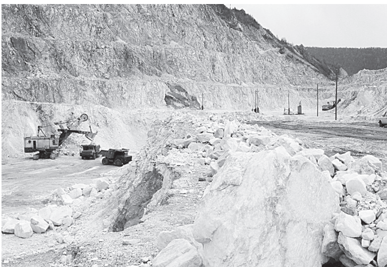
Первая очередь карьера Перевал