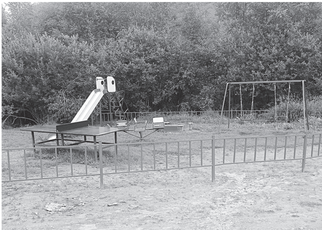
Детская площадка в Култукке

Еще три проекта тоже реализуются районом: создание виртуальной энциклопедии по объектам культурного наследия Слюдянки; создание кабинетов психологической разгрузки для детей и их родителей (в том числе для детей, чьи отцы находятся в зоне СВО) в школах №1 и №2 г. Слюдянки, №10 г. Байкальска и №7 п.