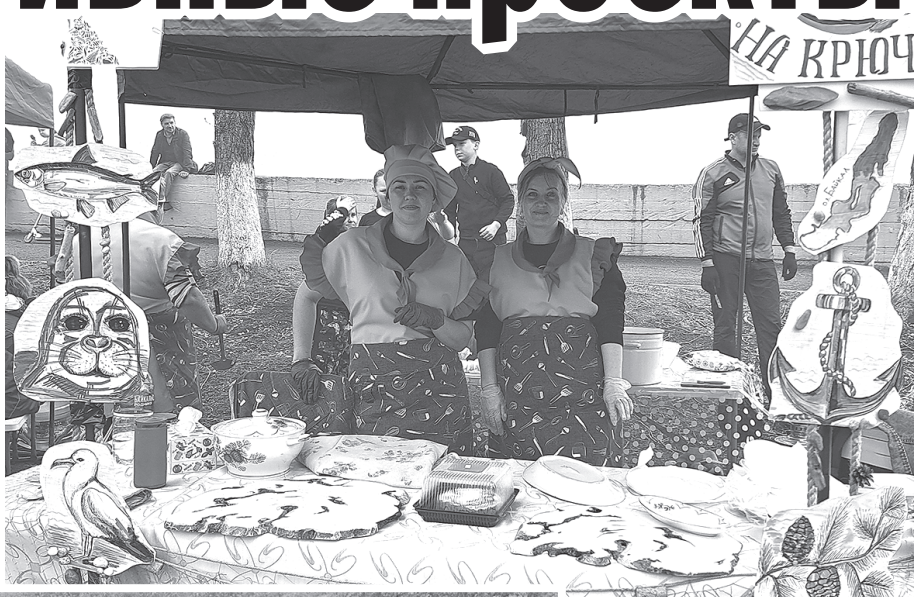
Фестиваль ухи на Байкале

Свой проект на конкурсный отбор может подать инициативная группа граждан, некоммерческие организации, муниципальные автономные учреждения и др. Приоритетными направлениями являются: проведение ремонта автомобильных дорог, организация материально-технического обеспечения муниципальных учреждений социальной сферы, благоустройство территорий, организация и оснащение проведения культурных, спортивных, образовательных и молодежных мероприятий и т.д. Финансирование на реализацию инициативных проектов предусмотрено в бюджете Иркутской области, но авторы должны вложить в реализацию своего проекта так называемый инициативный платеж, он составляет 10 процентов от стоимости проекта. Также они должны представить мнения граждан по поводу своего проекта: письма поддержки или подписные листы, или гарантийные письма с готовностью участвовать в его реализации и тому подобное. Конкурсный отбор проходит в два этапа: муниципальный и региональный. И ещё один интересный момент: проекты представляют инициативные группы граждан, а реализуют их администрации поселений.