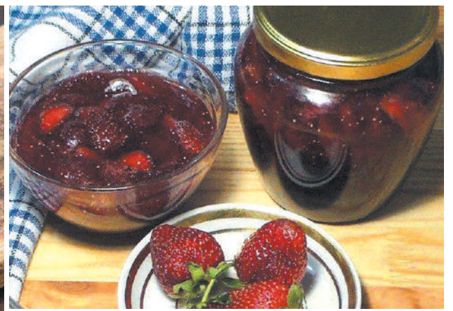
Клубника в микроволновке