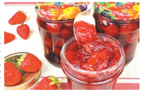
Клубника с абрикосами и ромом

Очень оригинальный рецепт для любителей кулинарных экспериментов. Понадобится: 500 г клуб-