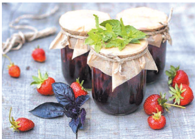
Клубника с базиликом