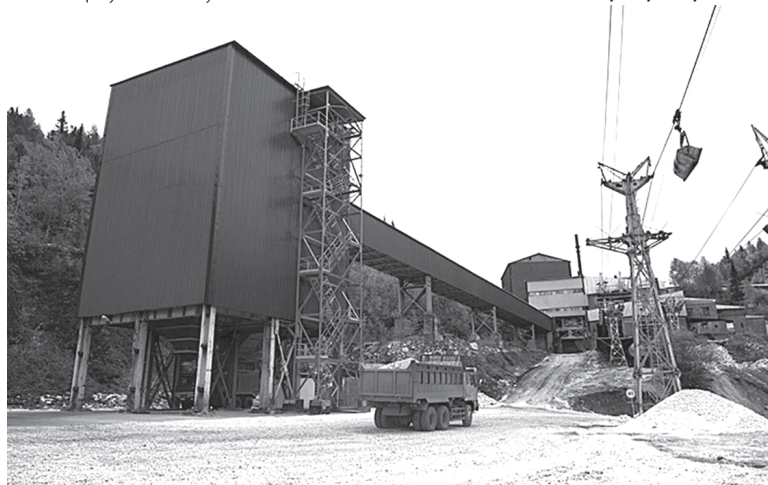
Фабрика первичного дробления, 2013 год. Позже канатная дорога была демонтирована