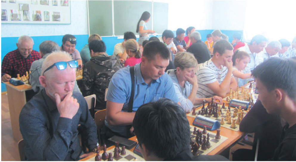
Играет команда «Юбилейный» (Слюдянка)