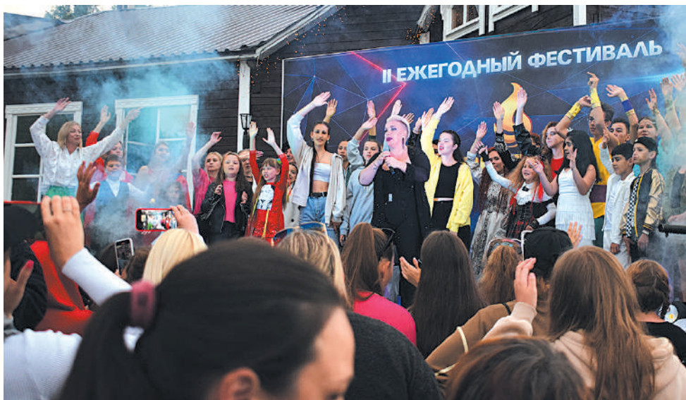
Завершающая песня фестиваля