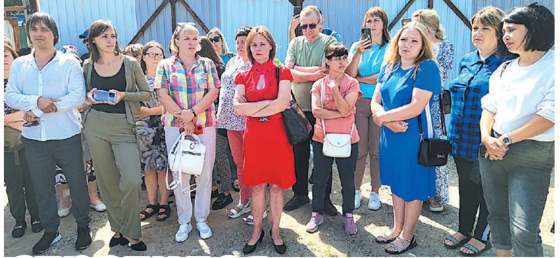
Жители Слюдянки задают вопросы губернатору