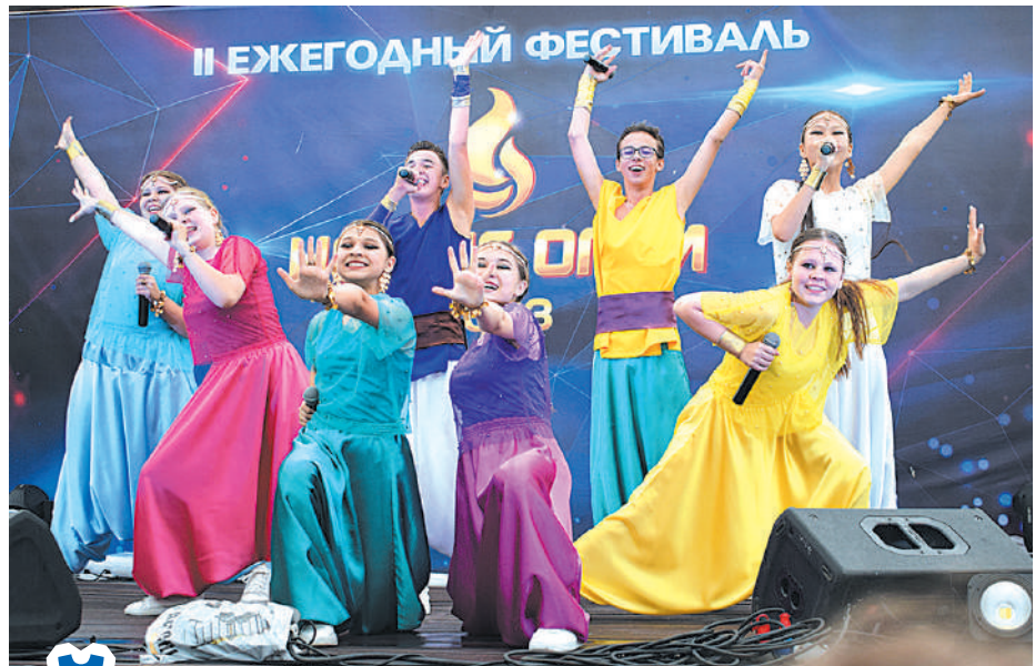
Студия эстрадного вокала «Акцент», г. Улан-Удэ