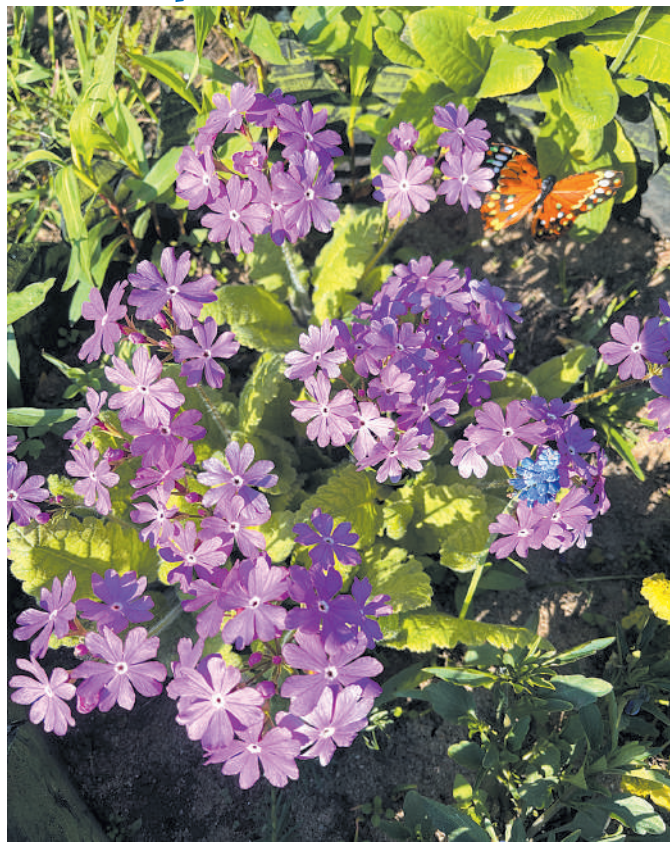
Примула, первоцветы на приусадебном участке.