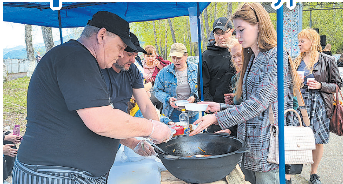
Уха на пробу