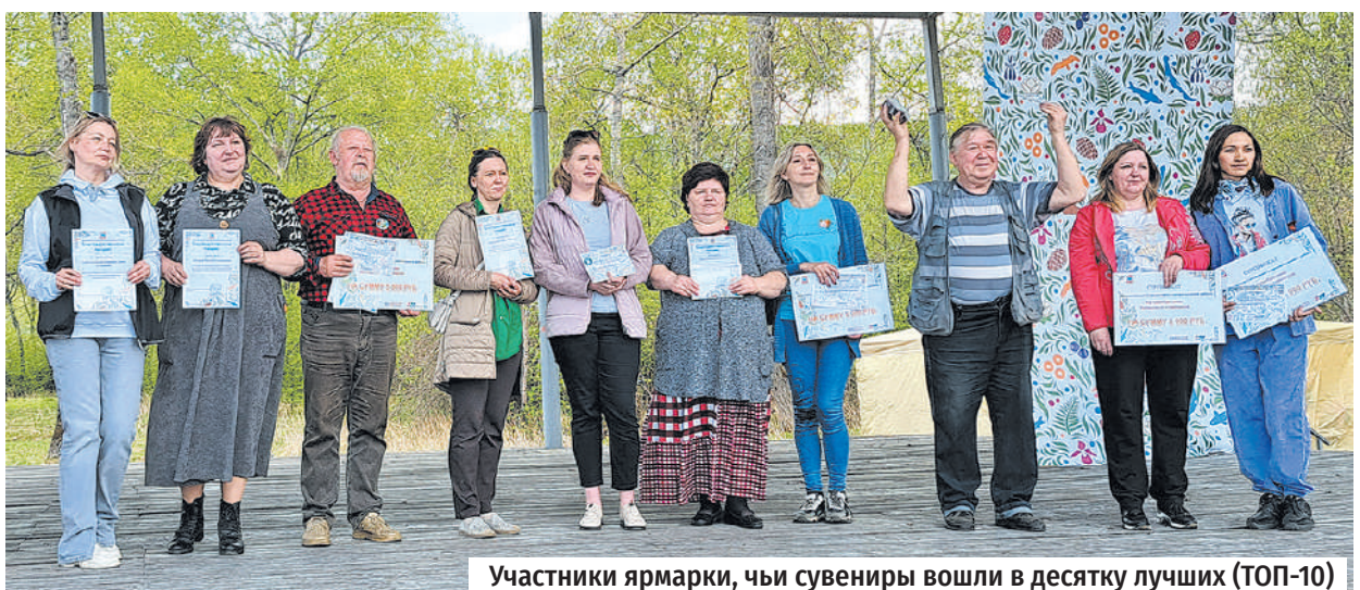
Участники ярмарки, чьи сувениры вошли в десятку лучших (ТОП-10)