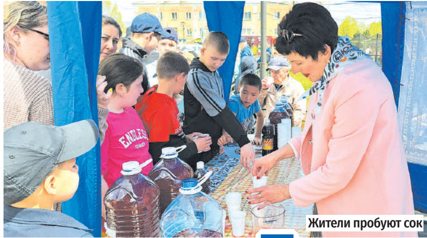
Жители пробуют сок