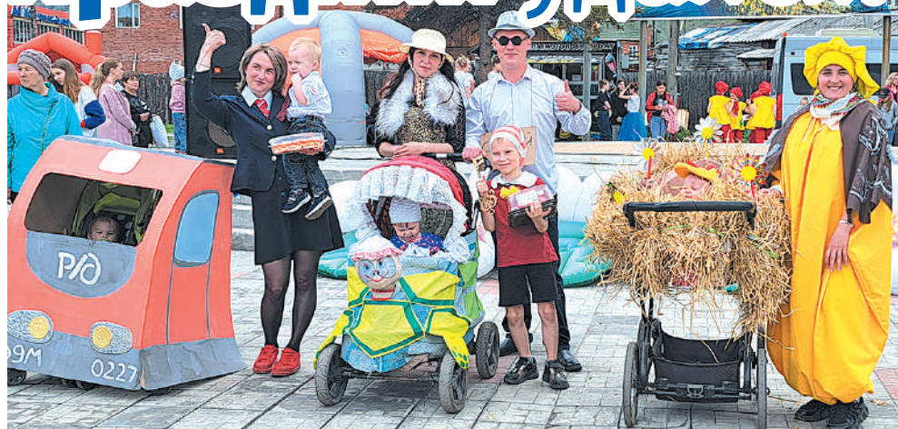
Парад колясок «Карета для малыша»