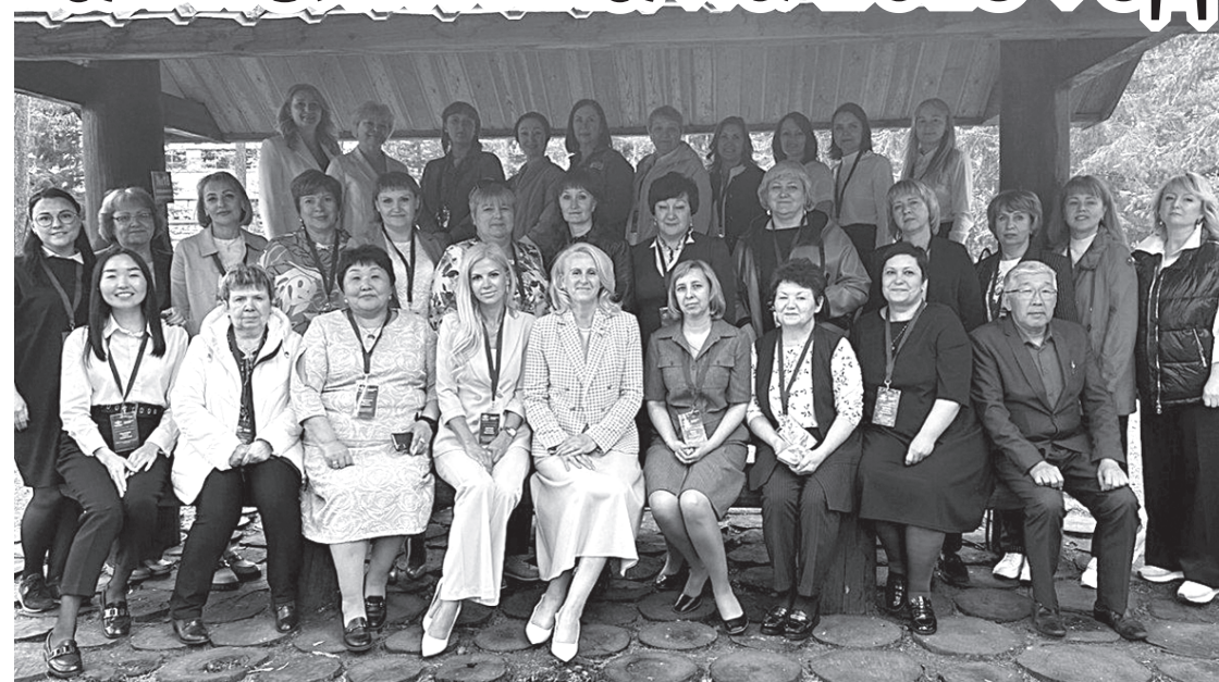
Участники коллегии – руководители финансовых органов муниципальных образований области

В 2023 году особое значение имеют взвешенные подходы к реализации