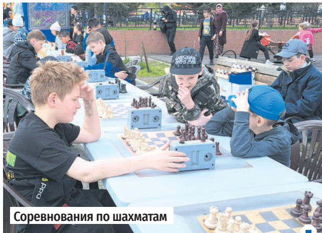
Соревнования по шахматам

Первый день лета традиционно начинается с празднования Дня защиты детей. На площади г. Слюдянки собрались самые юные жители, ведь для них организовали очень яркую и насыщенную программу.