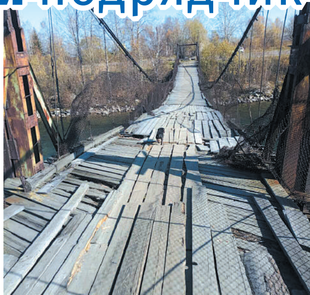
Мост через Снежную (в аварийном состоянии)

– Мост через Снежную – важный объект, соединяющий населенные пункты двух субъектов России – посёлок Новоснежная Иркутской области и более крупное село Выдрино Республики Бурятия, в котором расположены все социальные объекты. Существующий мост построен более 40 лет назад и находится в аварийном состоянии. Первоочередная задача администрации