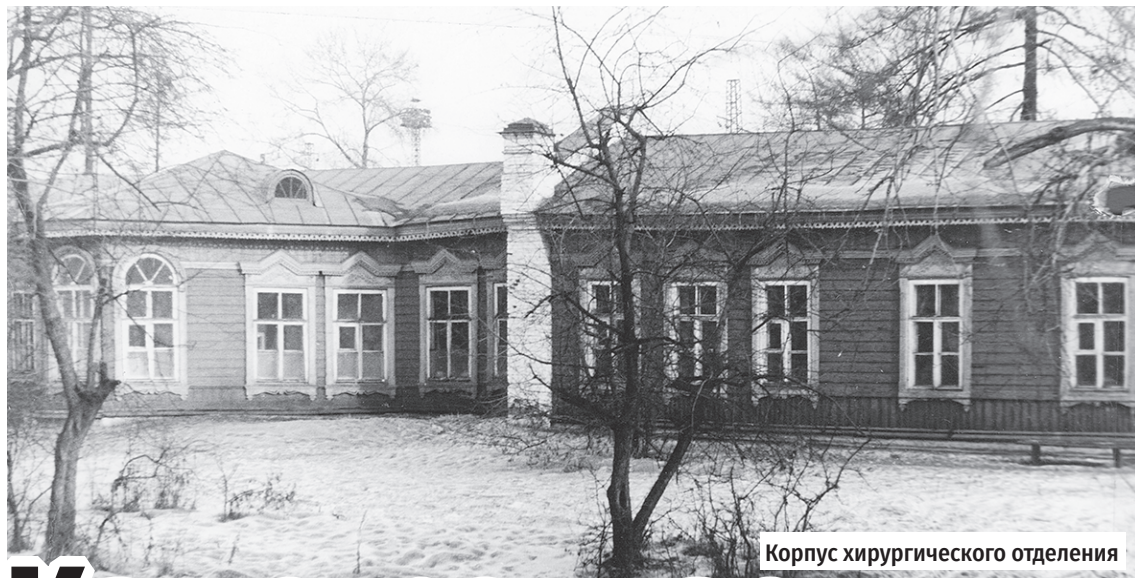
Корпус хирургического отделения