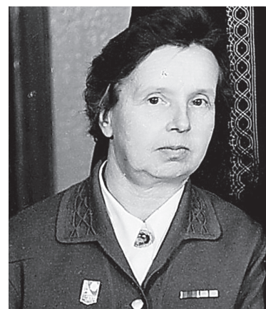
Из общего фото 70-х годов

же от ранения умерла и мама. В центре города, недалеко от Исаакиевского собора, жила родная тетя Ани. Девушка перебралась к ней и начала