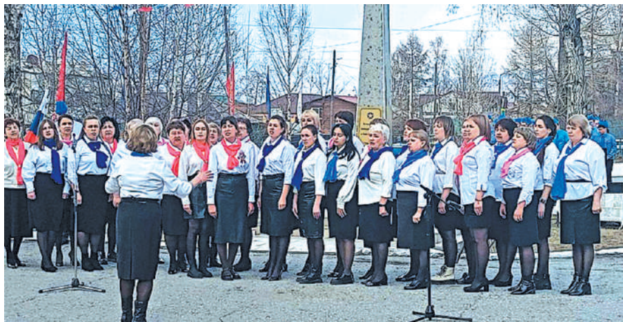
Хор учителей с песней «Обелиск»