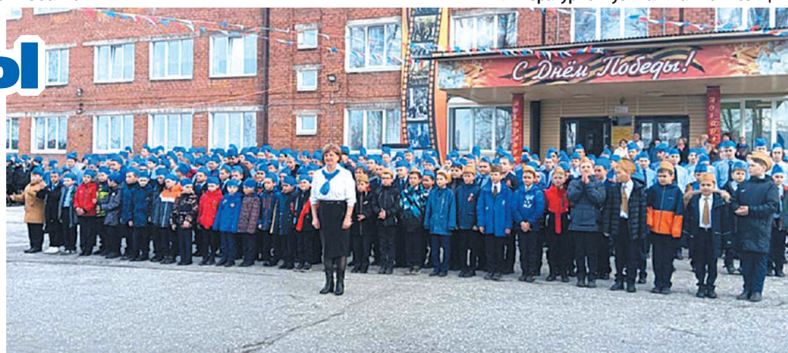
Хор юношей школы с песней «Жди меня»