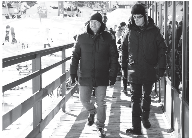
Губернатор Игорь Кобзев и министр Максим Решетников на Горе Соболиной

– За счёт федеральных и областных средств с 2019 года мы строим на территории ОЭЗ объекты обеспечивающей инфраструктуры. «Ворота Байкала» привлекают инвесторов. В качестве резидентов зарегистрировано 18 компаний с планируемым объемом инвестиций 17,7 млрд рублей. Десять из них стали резидентами в прошлом году. Планируется создать около тысячи новых рабочих мест. Якорным резидентом является горнолыжный курорт «Гора Соболиная». Сегодня мы увидели, насколько этот курорт востребован. В выходной день здесь очень много людей, которые занимаются спортом, – отметил губернатор.