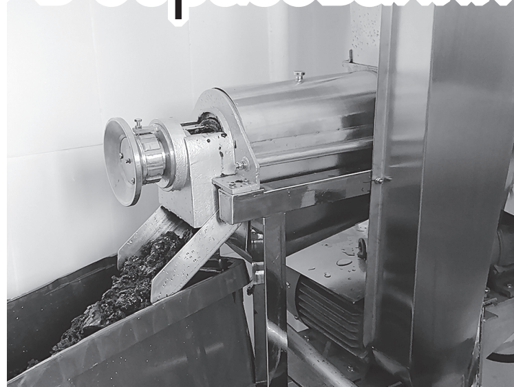
Обработка технологического процесса приготовления ягодных сиропов