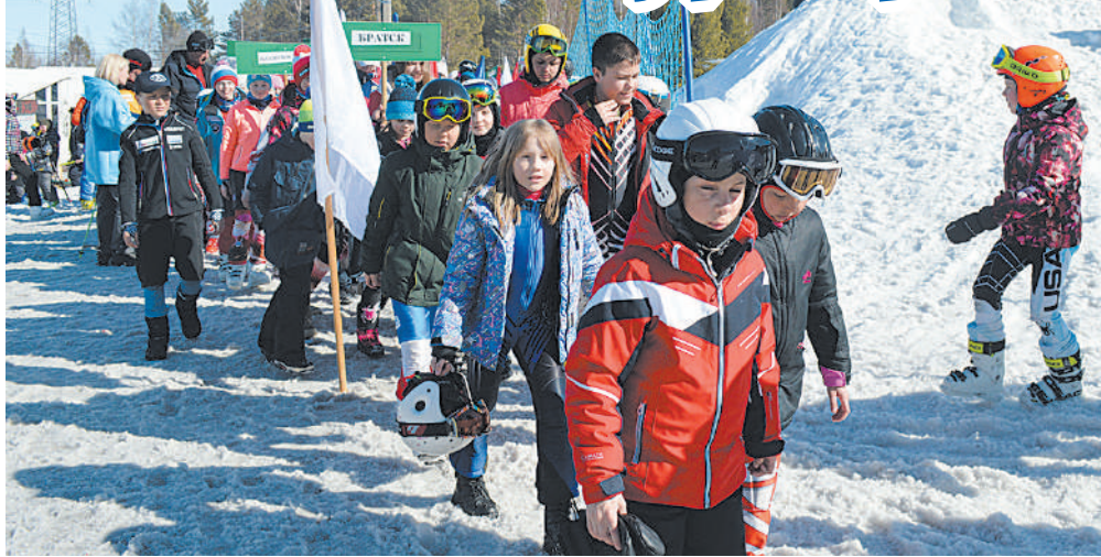
Парад. Открытие соревнований