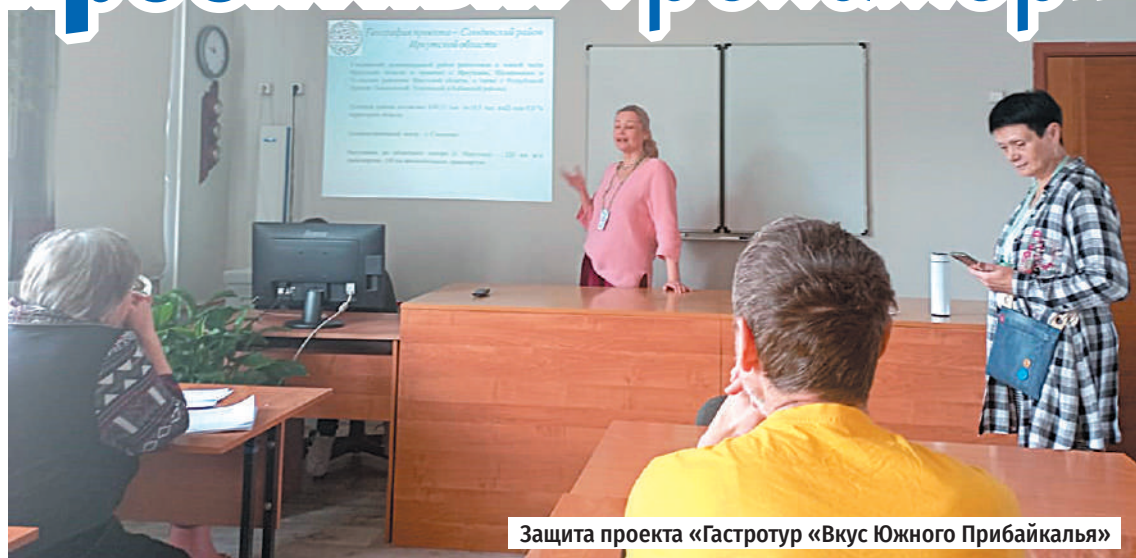
Защита проекта «Гастротур «Вкус Южного Прибайкалья»

Первое место у проекта «Речеветик» Эржэны Серебренниковой, Республика Бурятия, по созданию круглогодичных домиков для отдыха, оздоровления и развития для многодетных семей и семей с детьми с ограниченными возможностями здоровья в Горячинске.