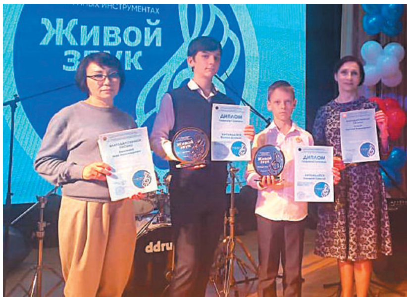
Победители конкурса из г. Байкальска с руководителями

Если обратиться к истории, то можно узнать, что предком всех инструментов со струнами считается