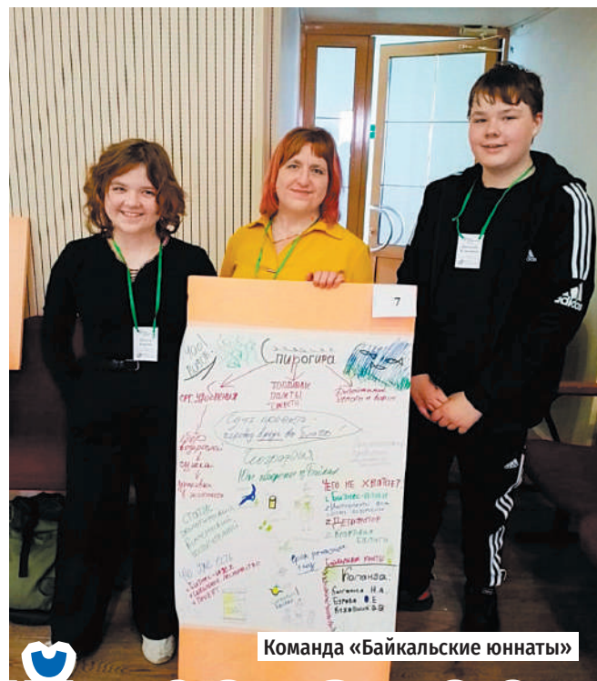
Команда «Байкальские юннаты»