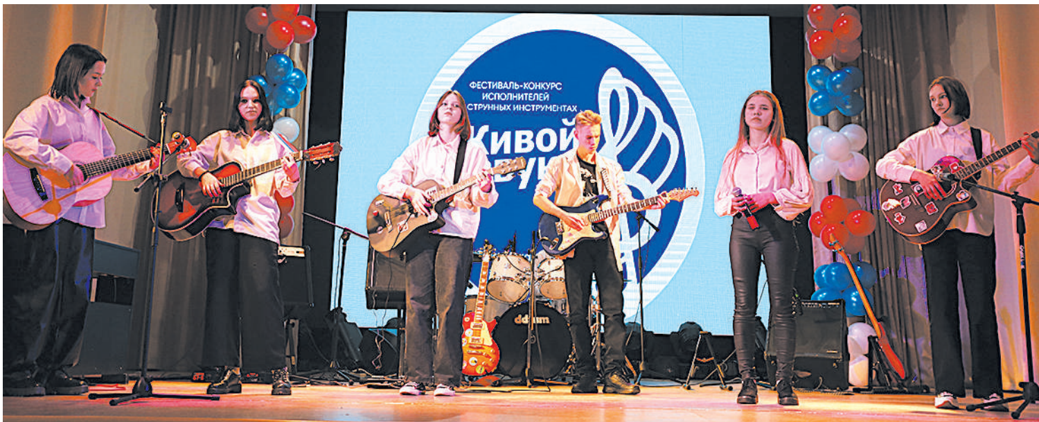
Вокально-инструментальный ансамбль «Играй, гитара!» из г. Тайшета