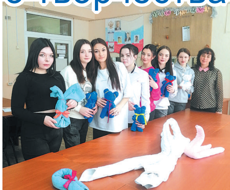
Участники мастер-класса «Эстетика для полотенец»

Завершился «Снегомэн» созданием большого лежащего снежного Будды на городской набережной и коллективной медитацией на тишину Байкала.