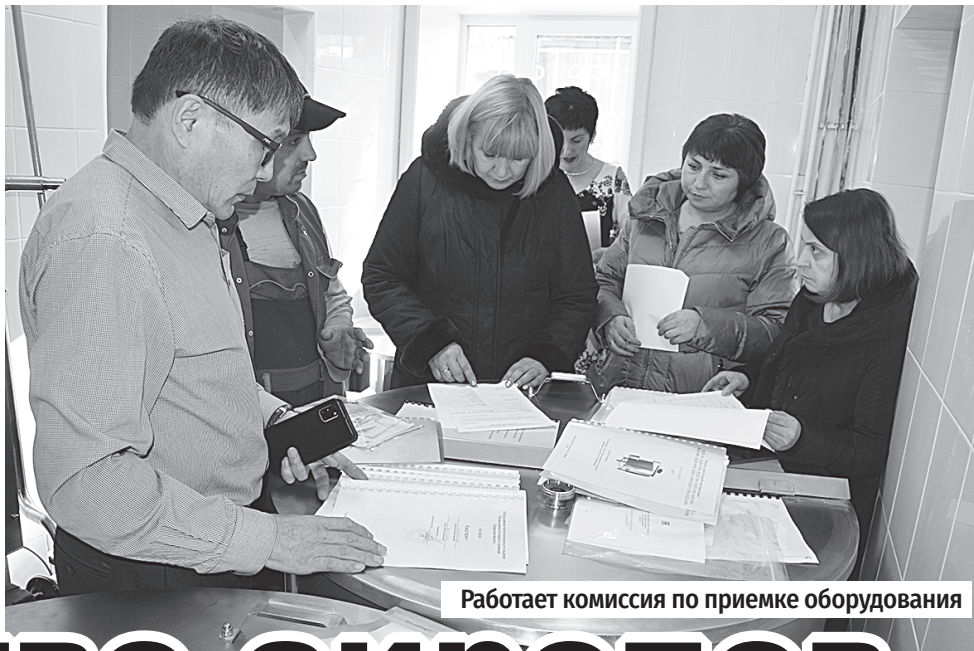
Работает комиссия по приемке оборудования