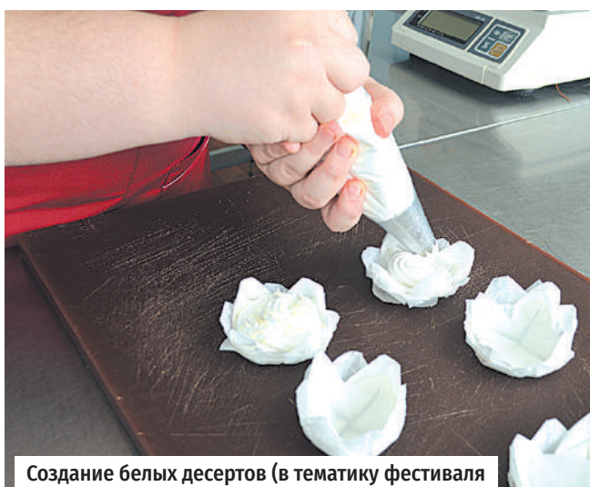
Создание белых десертов (в тематику фестиваля)