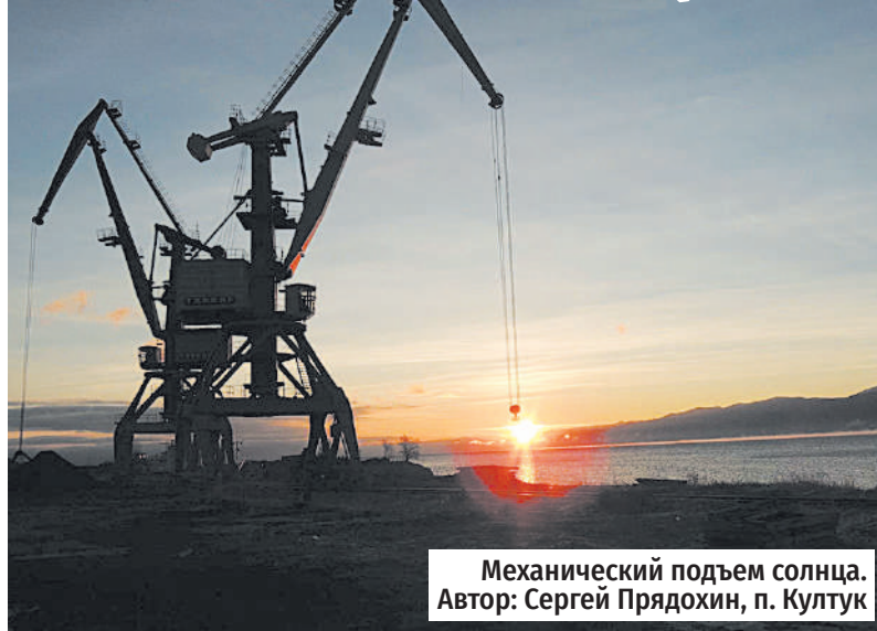
Механический подъем солнца.