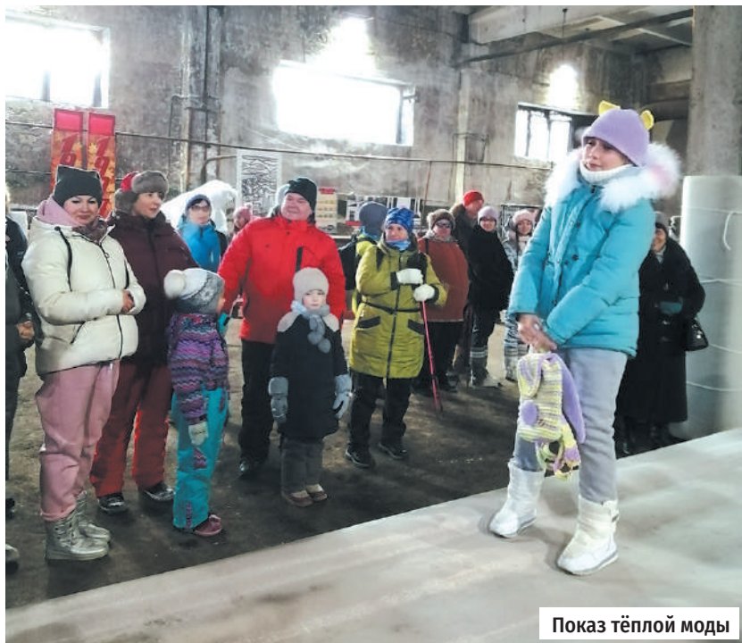
Показ тёплой моды