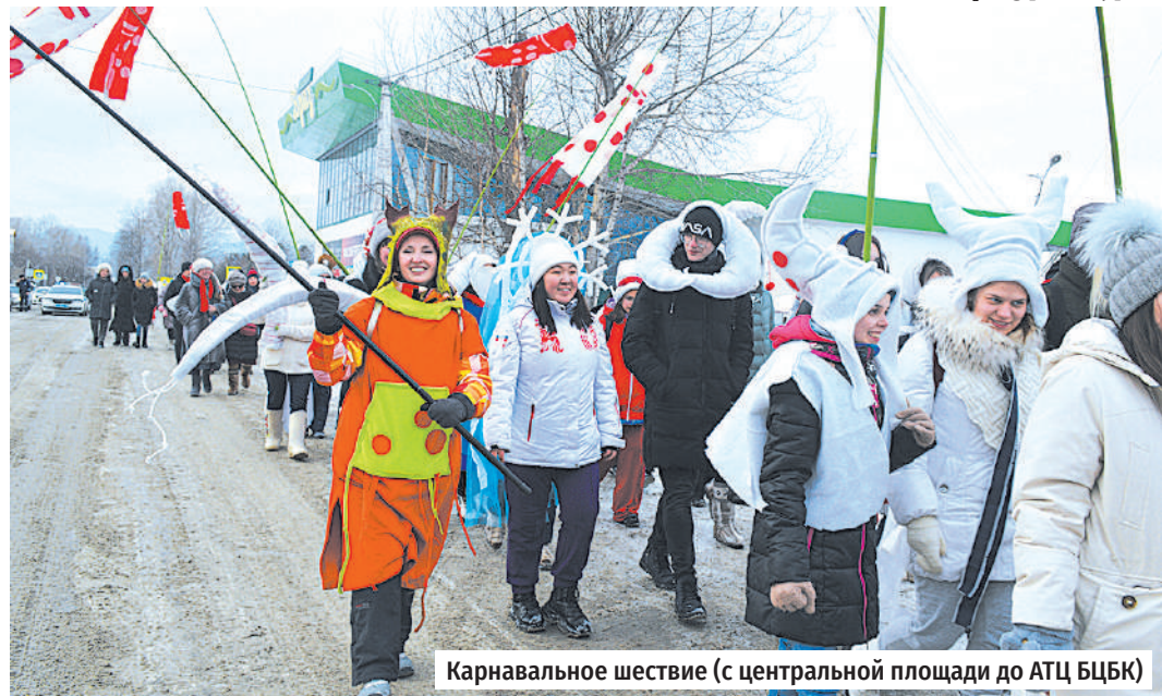
Карнавальное шествие (с центральной площади до АТЦ БЦБК)