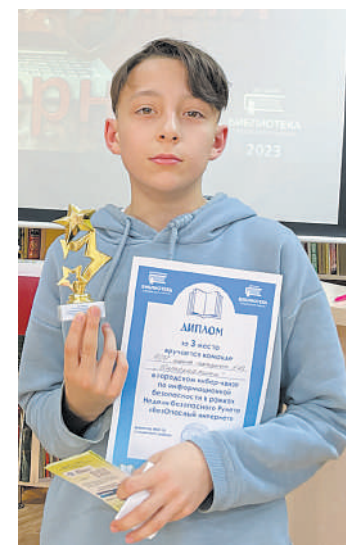
3-е место – школа №23

ветом, поддержкой и принятием, и при этом его не осудят и не пристыдят;