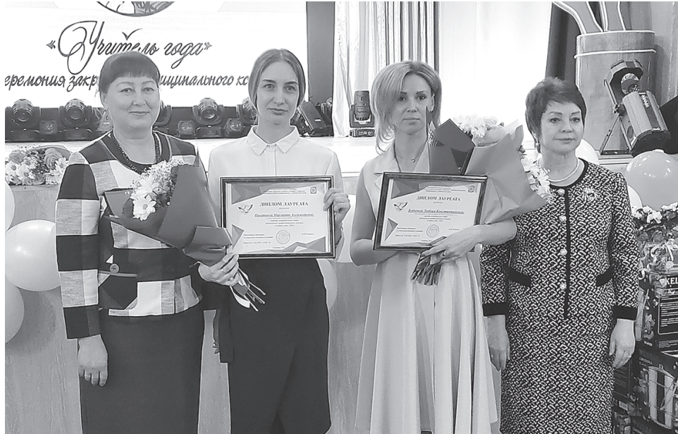
Награждение лауреатов конкурса