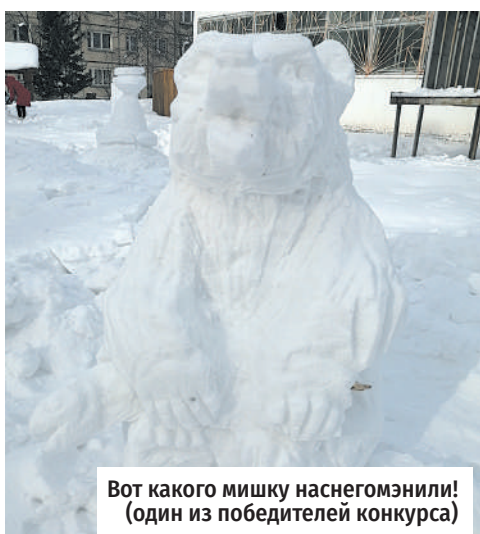
Вот какого мишку наснегомэнили! (один из победителей конкурса)