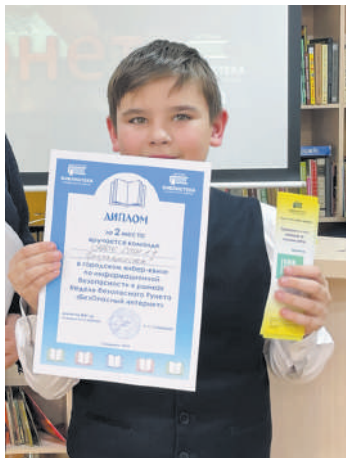
2-е место – школа №24

– объяснить ребенку, что он не один, что он всегда может обратиться к своим близким взрослым за со-