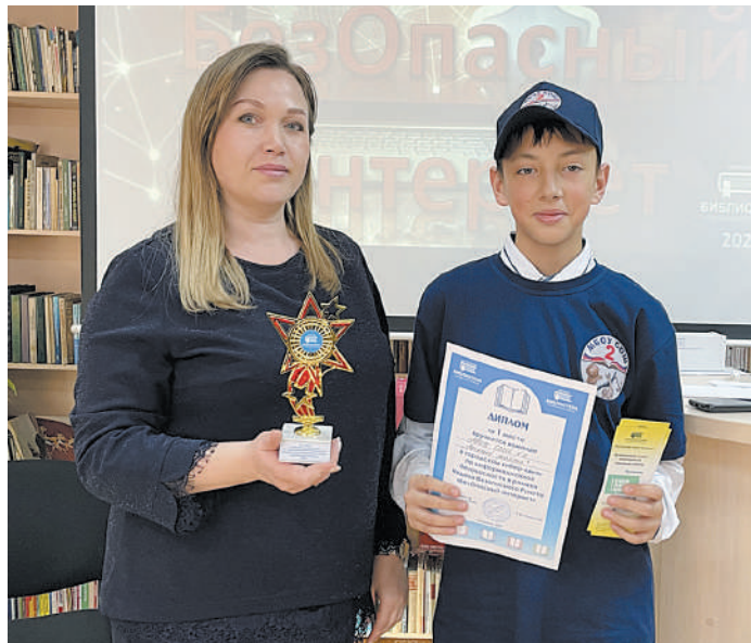
1-е место – школа №2

Угрозы в сети стали темой городского кибер-квиза «БезОпасный интернет», который 9 февраля провела детская библиотека Слюдянского района среди шестиклассников города. Время выбрано неслучайно, в эти дни в России проходит традиционная неделя безопасного Рунета, приуроченная к Международному дню безопасного интернета. Свое участие в городском кибер-квизе заявили пять команд. Битва была жаркой во всех смыслах. Юные пользователи сети по-взрослому состязались в знании разных аспектов кибербезопасности и по-детски, искренне и непринужденно, радовались каждой своей маленькой победе. Ребята узнали, почему приложения можно скачивать только в официальных магазинах приложений, за-