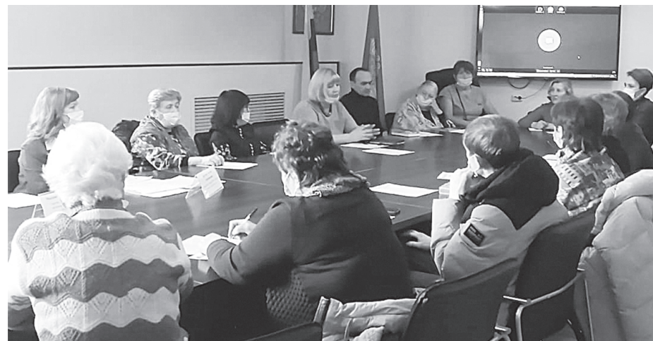
Секция «Садоводческие некоммерческие товарищества»