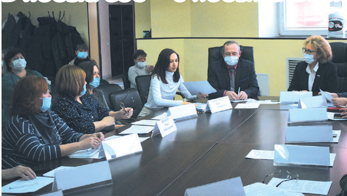
Работает экспертный совет