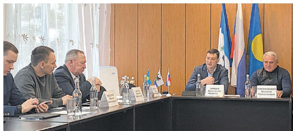
Областное совещание в Байкальске по развитию города под руководством первого зама губернатора Константина Зайцева 3 января

Реализация программы предусматривает два этапа: в период с 2023 по 2027 годы будут запущены процессы,